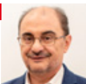
Javier Lambán Montañes